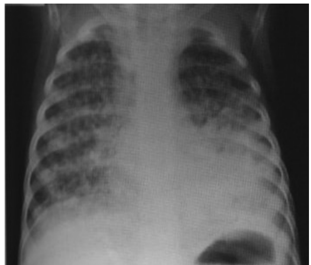
Figura 3. TB pulmonar primaria diseminación hematogena (miliar).

Muchos niños tienen antecedentes de episodios respiratorios previos o enfermedades preexistentes como asma, secuelas posinfecciosas, VIH o fibrosis quística; en estos casos se debe comparar con las Rx previas del paciente. Al comparar las imágenes, se debe pensar en los diagnósticos diferenciales de las complicaciones que estas entidades pueden