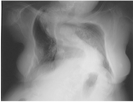
Fig. 4.1a. RX ángulo de 2a Cobb.

de 100 grados son considerados graves y el riesgo de desarrollar un fallo respiratorio, una hipoventilación alveolar y un cor pulmonale es muy alto, aunque, incluso con esta magnitud de curvatura, pueden permanecer asintomáticos.