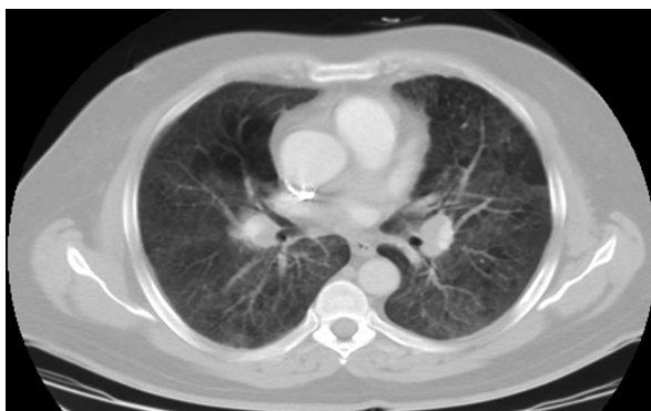
Figura 2. Tomografía computada de tórax con contraste. Aumento del intersticio peribronquial parahiliar bilateral con patrón de vidrio esmerilado en forma difusa en ambos campos pulmonares. Infiltrado reticular apical anterior bilateral de predominio izquierdo