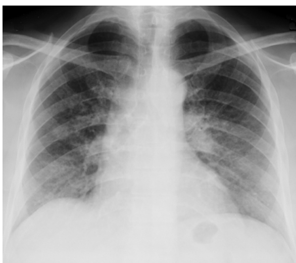
Figura 1. Radiografía de tórax. Aumento del intersticio peribronquial parahiliar bilateral. Infiltrado reticulonodular difuso en ambos campos pulmonares

En la radiografía de tórax ( Figura 1 ) se encontró aumento del intersticio peribronquial parahiliar bilateral e infiltrado reticulonodular difuso en ambos campos pulmonares. La tomografía computada de tórax con contraste ( Figura 2 ) reveló un aumento del intersticio peribronquial parahiliar bilateral con patrón de vidrio esmerilado en forma difusa en ambos campos pulmonares; e infiltrado reticular apical anterior bilateral de predominio izquierdo.