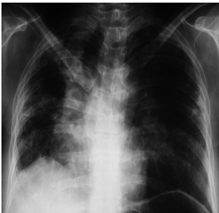
Figura 4. Radiografía de tórax. Engrosamiento peribronquial, mediastino ensanchado con retracción traqueal, elevación de hemidiafragma derecho e hiperinsuflación de pulmón izquierdo.

La radiografía de tórax ( Figura 4 ) mostró engrosamiento peribronquial, mediastino ensanchado con retracción traqueal, elevación de hemidiafragma derecho e hiperinsuflación de pulmón izquierdo. La